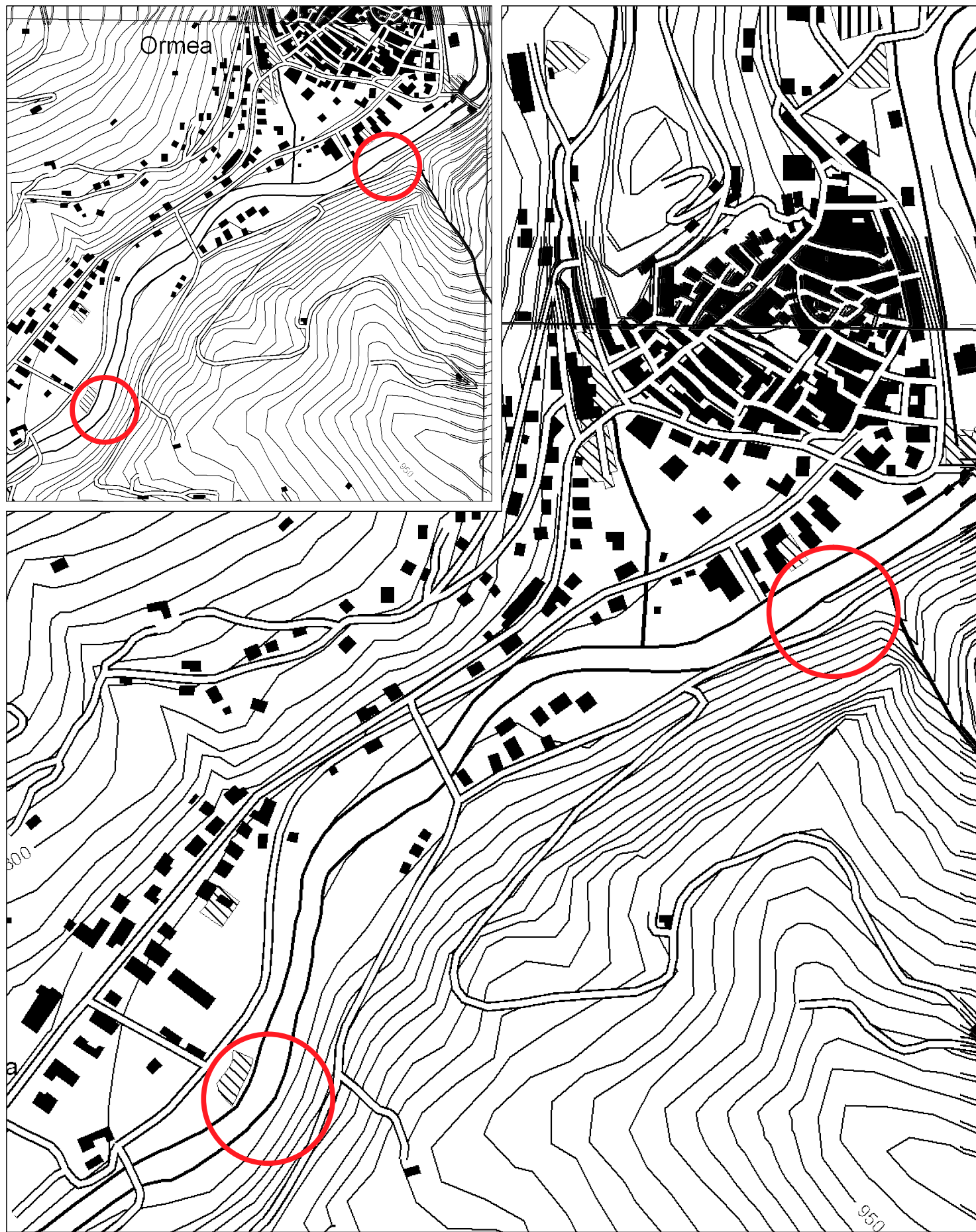
COROGRAFIA DELLE AREE DI INTERVENTO scala 1:5.000 / 1:10.000 concentrico di Ormea sez. 244_070 - carta tecnica regionale